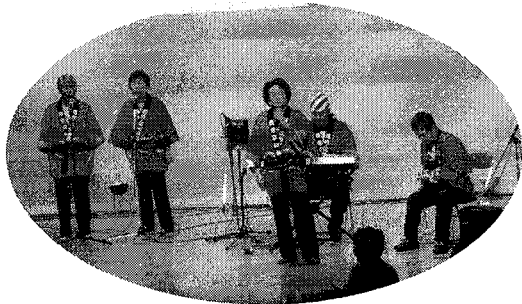
江州音頭と河内音頭で