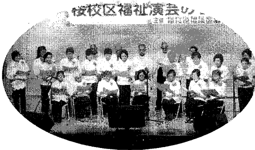
「なかよしサロン」のコーラス