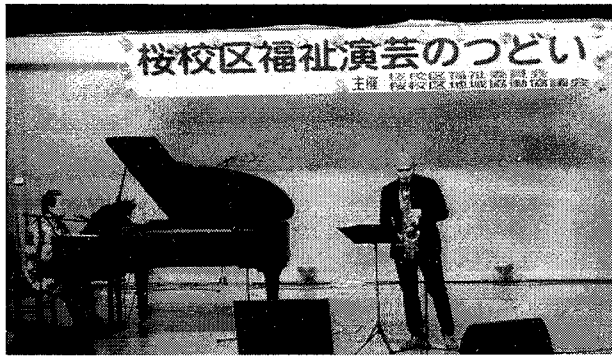
ピアノとサクソフの協演 弾き語り